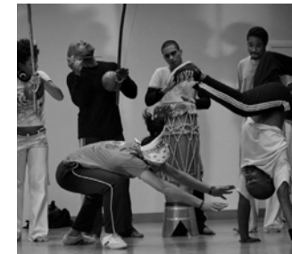
Cordão de Ouro

Der Capoeira-Verein Cordão de Ouro aus Braunschweig wurde 2008 gegründet und steht unter der Leitung von Contra Mestre Pelezinho. Capoeira ist eine brasilianische Kampfkunst und für Jung und Alt geeignet. Mit Instrumenten und Gesang wird das Spiel begleitet und so nicht nur die Koordination von Hand und Fuß gefördert, sondern auch das Rhythmusgefühl gestärkt. Weitere Informationen finden Sie unter: www.capoeira-cordao-de-ouro.de