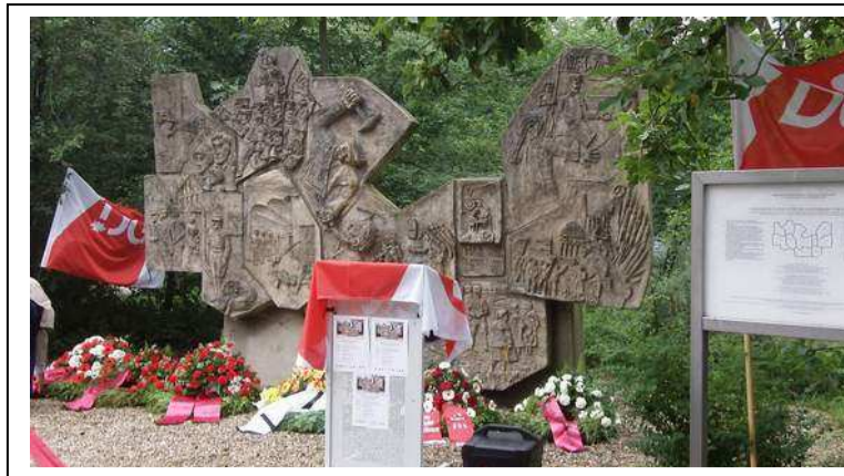
Gedenkstein am Pappelhof in Rieseberg

Worum war es bei diesen Morden gegangen?