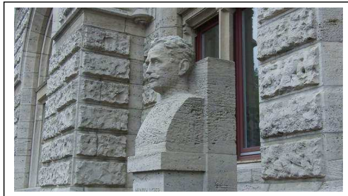
Heinrich Jasper Ehrenmal

Die Rieseberg-Morde von 1933 spielen in der Braunschweiger Erinnerungskultur eine besondere Rolle. Jedes Jahr findet anlässlich dieser Morde eine große Gedenkfeier am 4. Juli an der Stelle am Pappelhof in Rieseberg statt, an der zehn willkürlich ausgesuchte Kommunisten und Sozialdemokraten von einem SS-Kommando gefoltert und heimtückisch ermordet wurden.